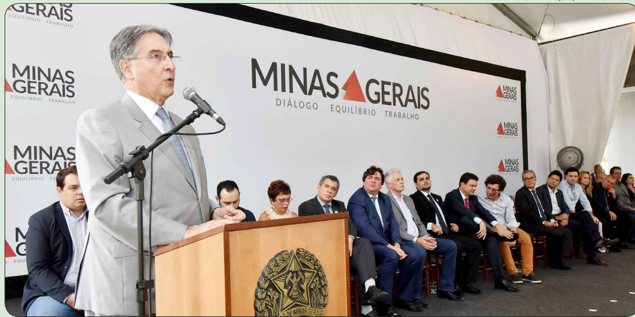
Durante o evento, o governador Fernando Pimentel também ressaltou a importância de os deputados mineiros estarem com o olhar voltado para as demandas da população

O governador Fernando Pimentel entregou, na sexta-feira (13), as chaves de 145 veículos que beneficiarão 122 municípios mineiros. A compra dos carros, avaliada em R$ 9,8 milhões, foi feita com recursos de emendas parlamentares de deputados estaduais. Do total entregue, 101 serão doados via Secretaria de Estado de Saúde (SES) e outros 44 por meio da Secretaria de Estado de Governo (Segov). Os recursos foram empenhados para aquisição de ambulâncias, minivans e veículos convencionais. Em seu discurso, Fernando Pimentel lembrou que, paralelamente aos esforços para equilibrar as contas e continuar o crescimento do Estado, o Governo também atua em outra frente para buscar novos recursos para os cofres públicos, a exemplo da Lei Kandir. (Página 3)