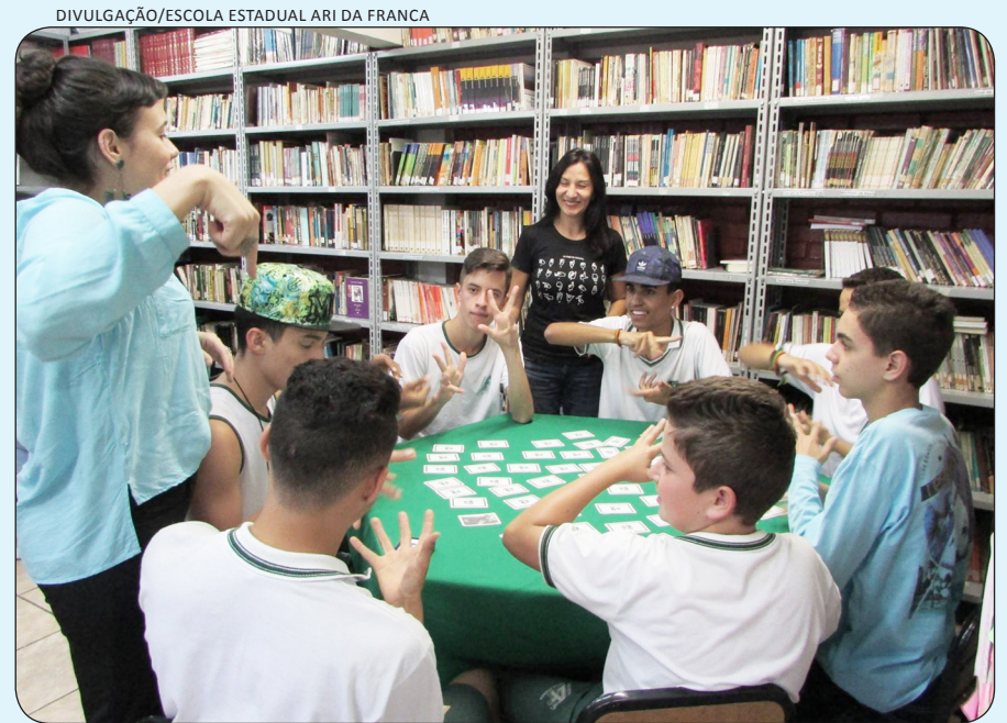
DIVULGAÇÃO/ESCOLA ESTADUAL ARI DA FRANCA

Um baralho de cartas, com ilustrações da Linguagem Brasileira de Sinais (Libras) e respectivos significados em português, é a nova ferramenta para o ensino desse método de comunicação. O jogo foi desenvolvido por alunos da Universidade Estadual de Minas Gerais (Uemg), e está tornando mais acessível o aprendizado de Libras. Chamado de Librário, o baralho possui diversas formas de ser trabalhado, como em jogos de mímica ou de memorização. Segundo o IBGE, a deficiência auditiva atinge 2,5% da população mineira. (Página 3)