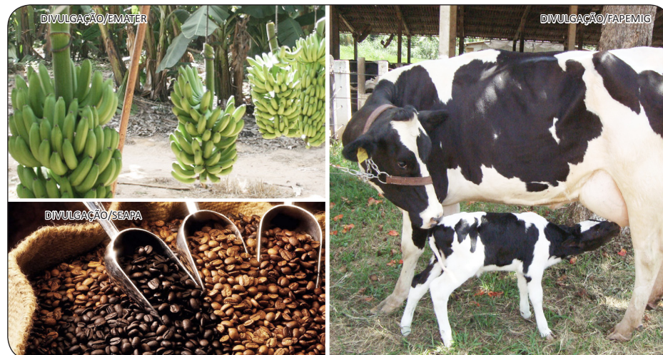
A economia regional é baseada na pecuária leiteira e na produção de café e banana

As palestras, workshops e oficinas acontecem paralelamente ao circuito de ações e serviços. Durante todo o período da programação, também serão realizadas as feiras da agricultura familiar, da economia popular solidária, cadastro de artesão e exposição de artesanato. Também estão previstas apresentações artísticas de grupos locais.