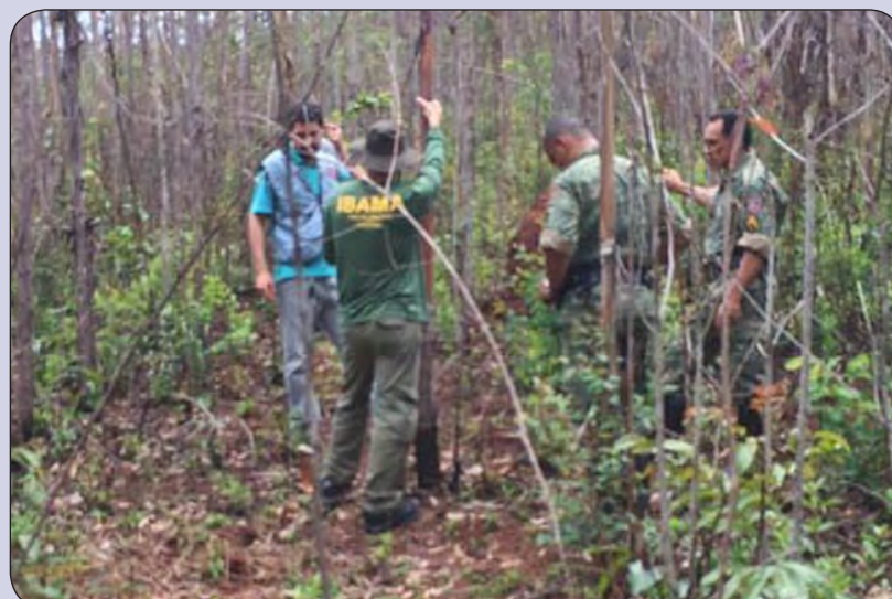
Cerca de 70 agentes participam das ações, divididas entre 17 equipes estruturadas

Equipes do Governo de Minas Gerais e de órgãos federais participam da Primeira Operação do Programa de Fiscalização Integrada na Bacia do Rio das Velhas, que vem sendo realizada desde 19 deste mês, em quatro municípios localizados na região onde nasce o rio: Nova Lima, Rio Acima, Itabirito e Ouro Preto. Até terça-feira (21), já haviam sido fiscalizados 54 alvos, com aplicação de mais de 260 mil reais em multas. As ações buscam identificar danos ao meio ambiente, estimulando o uso sustentável dos recursos naturais e a melhoria da qualidade de vida das populações. (Página 3)