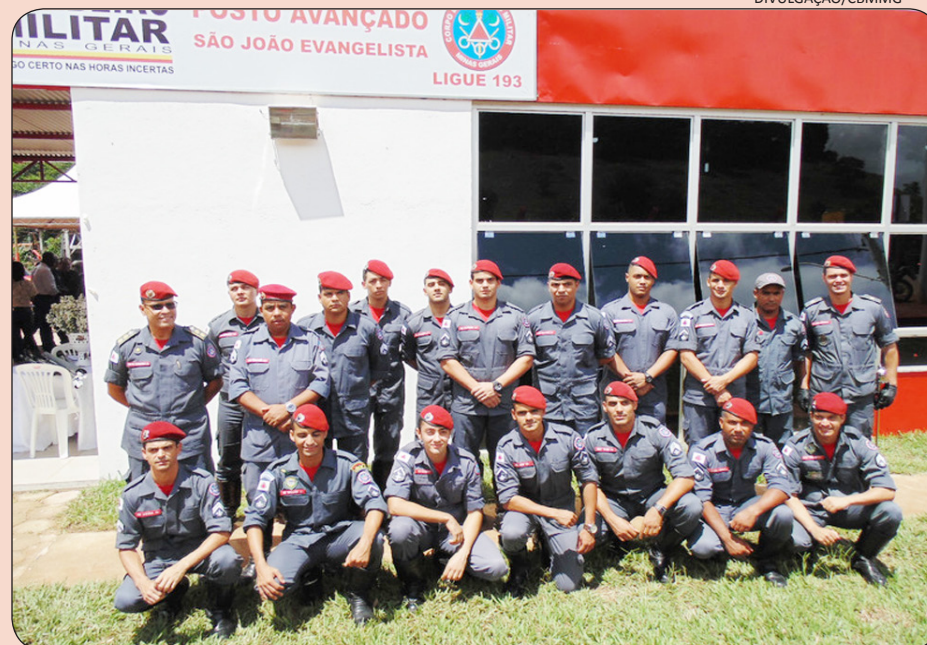
Efetivo do posto avançado de São João Evangelista